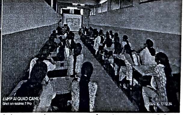
वीडियो के माध्यम से रक्तदान पर चर्चा करते हुए स्वास्थ्य चिकित्सक