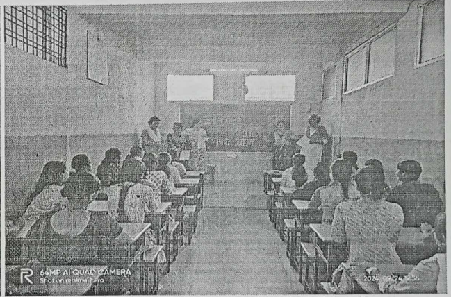
स्वास्थ्य संबंधी जानकारी देती हुई शिक्षिकाएँ